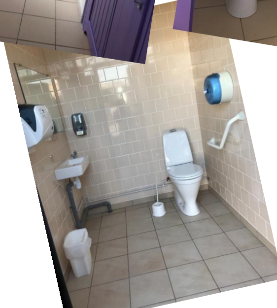
P. M. R.