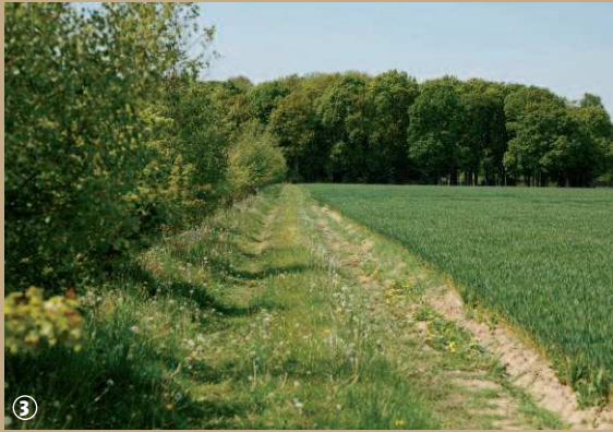
Chemin de campagne.