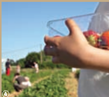
4 Cueillette des fraises

et cela depuis plus de deux siècles. A Phalempin, un petit groupe d'agriculteurs s'est spécialisé dans cette culture voici maintenant 20 ans, avec pour objectif premier de produire des fruits de qualité, tant au niveau du goût que de la fraîcheur : une coopération connue régionalement sous le nom de « Marché de Phalempin ». Pour profiter de toute leur saveur, il faut attendre la pleine saison, de la mi-mai au tout début de juillet, le meilleur moment pour les fraises de pleine terre. Quelques producteurs locaux organisent des ventes et dégustations qui donnent l'occasion aux visiteurs de découvrir l'exploitation et parfois même, de cueillir eux-mêmes leurs fruits ! C'est le cas, par exemple de la