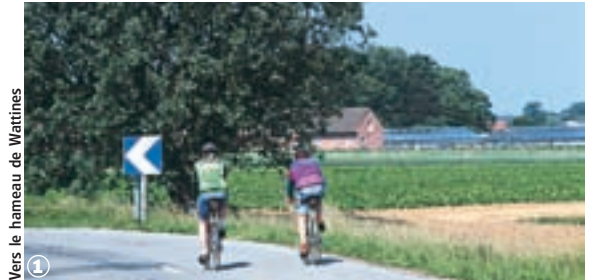
Vers le hameau de Wattines

Auchy-les-Orchies, Bersée, Cappelle-en-Pévèle, Coutiches, Faumont, Moncheaux, Mons-en-Pévèle, Nomain, Thumeries 35 km