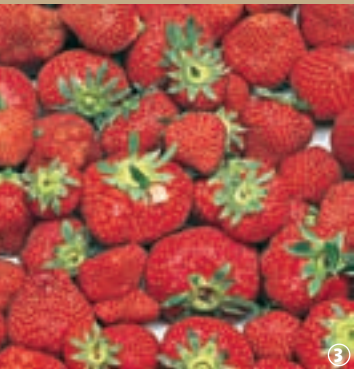
3 Prêtes à la dégustation

et cela depuis plus de deux siècles. A Phalempin, un petit groupe d'agriculteurs s'est spécialisé dans cette culture voici maintenant 20 ans, avec pour objectif premier de produire des fruits de qualité, tant au niveau du goût que de la fraîcheur : une coopération connue régionalement sous le nom de « Marché de Phalempin ». Pour profiter de toute leur saveur, il faut attendre la pleine saison, de la mi-mai au tout début de juillet, le meilleur moment pour les fraises de pleine terre. Quelques producteurs locaux organisent des ventes et dégustations qui donnent l'occasion aux visiteurs de découvrir l'exploitation et parfois même, de cueillir eux-mêmes leurs fruits ! C'est le cas, par exemple de la