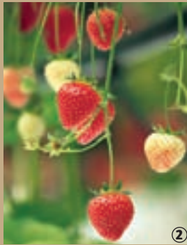
2 Prêtes à la cueillette

Saviez-vous que la Pévèle, pays paisible de fermes et d'exploitations agricoles, est le « Paradis des semences » depuis près de 150 ans ? Sa terre végétale, grasse et profonde, y donne des produits les plus variés et l'agriculture locale se distingue par ses grands espaces où sont cultivés en alternance betteraves, pommes de terre, céréales, chicorée, endives ou fraises. Il est d'ailleurs de tradition dans le Nord de cultiver les fraises,